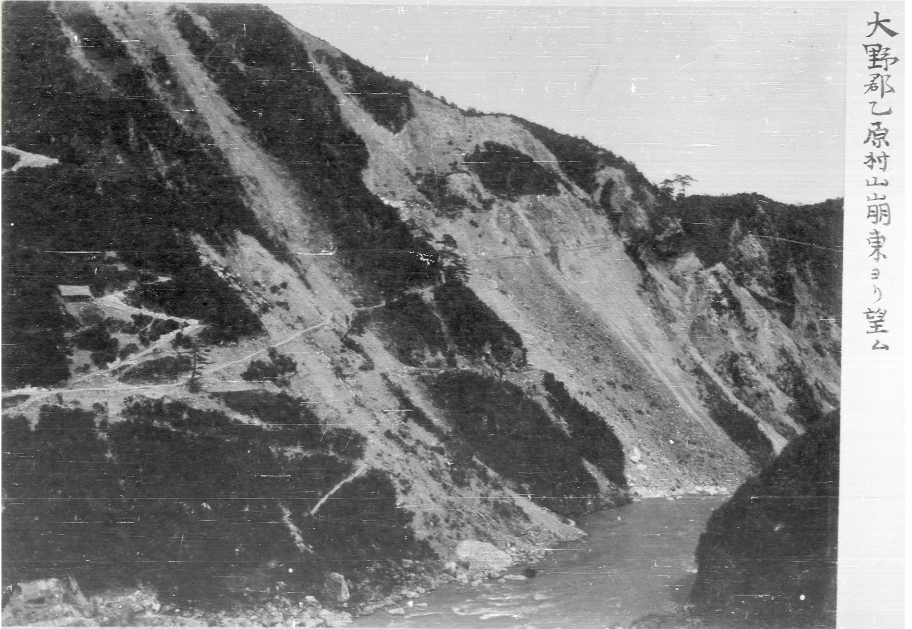
密（きび）・大柵の崩壊 (岐阜地方気象台提供マイクロフィルム「濃尾大地震災害写真」 -大野郡乙原村山崩東ヨリ望ム)

地元の言い伝えによると、付近の斜面が一面に崩壊し、土砂煙で空が暗くなる程で、中には揖斐川を一時堰止めたものもあったということです。